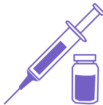
Jeringa, aguja y vial