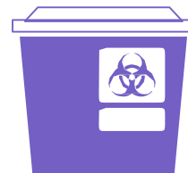
Recipiente de objetos puntiagudos para desechar jeringa y aguja