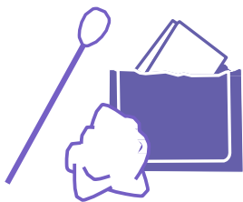
Torundas con alcohol